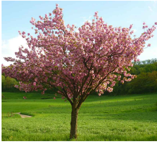
4. Ciliegio giapponese Prunus serrulata