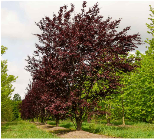
7. Mirabolano Prunus cerasifera