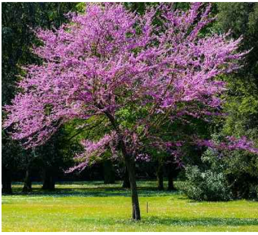
5. Albero di giuda Cercis siliquastrum