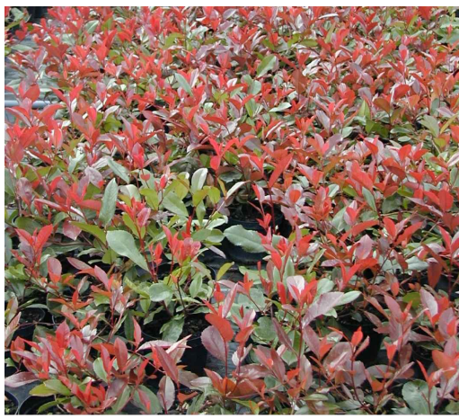
Fotinia Red Robin