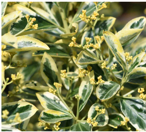
Euonymus del Japonicus Bravo