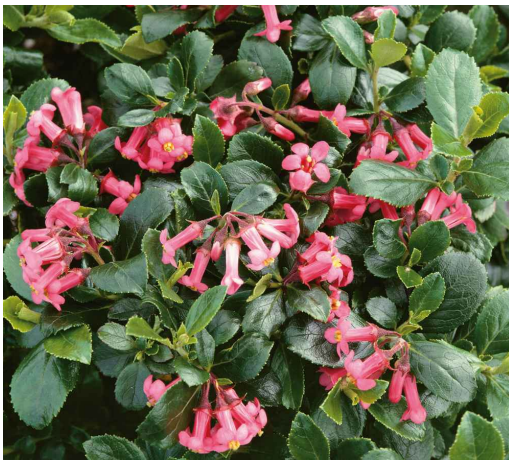
Escallonia Rubra Macrantha