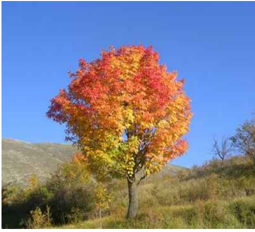
3. Sorbo domestico Sorbus domestica