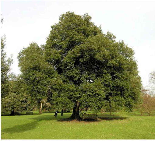
9. Leccio Quercus ilex