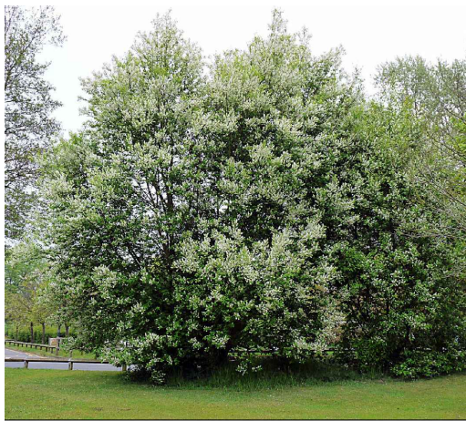
2. Pado Prunus padus