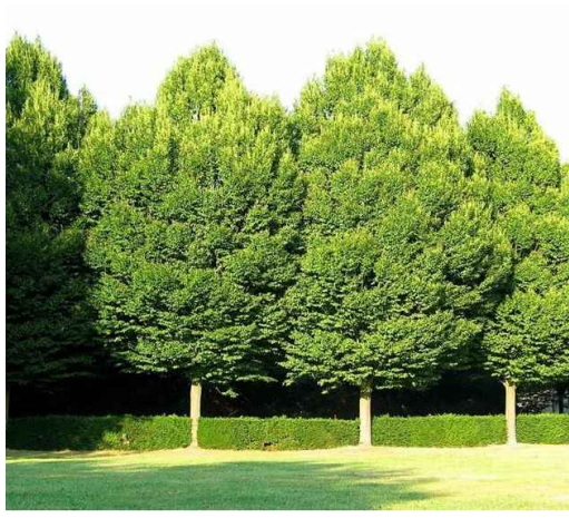
6. Carpino nero Ostrya carpinifolia