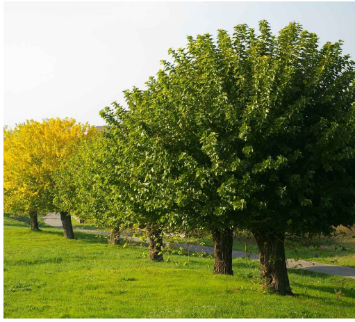
8. Gelso Morus ssp cultivar